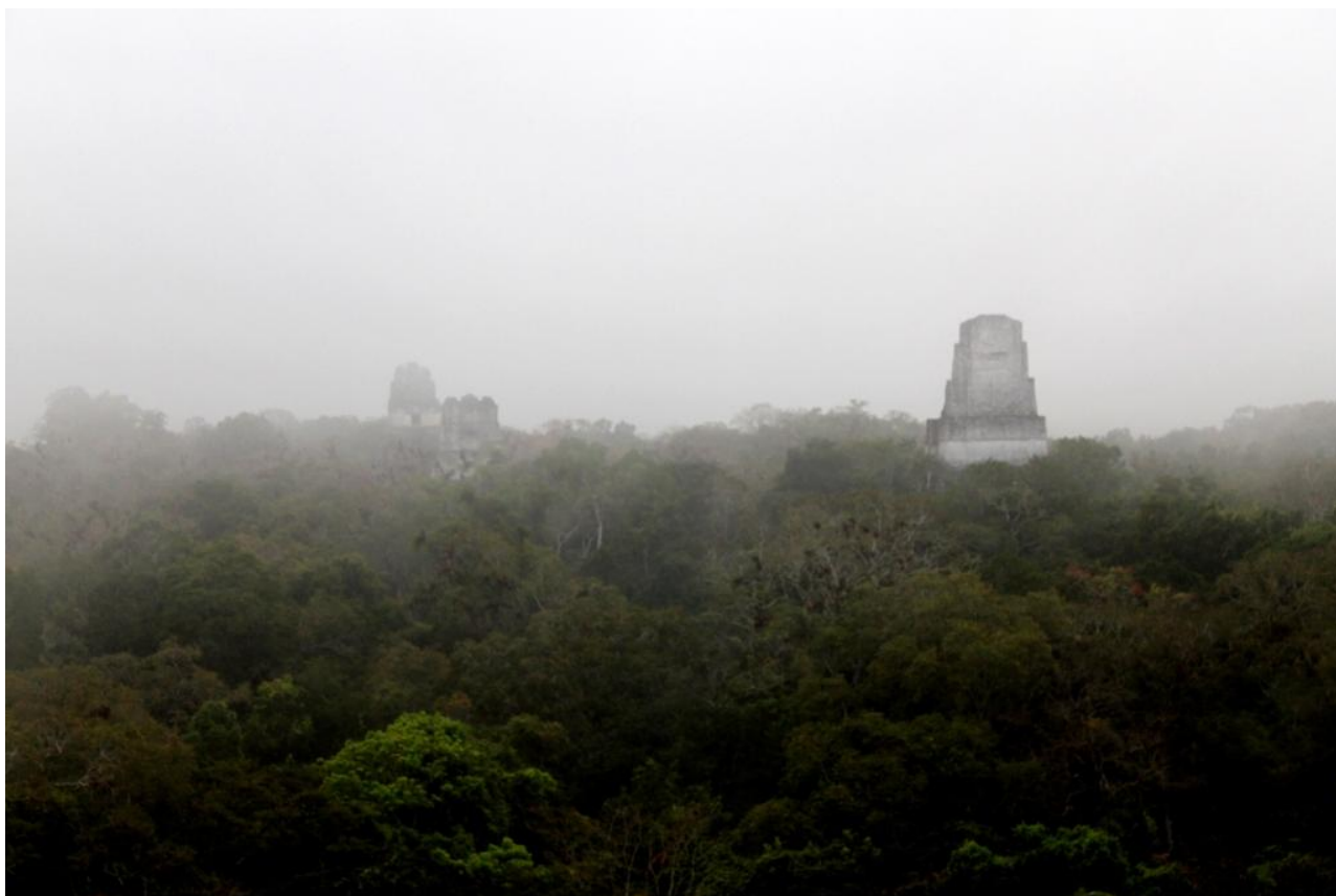
日の出直前のティカル遺跡